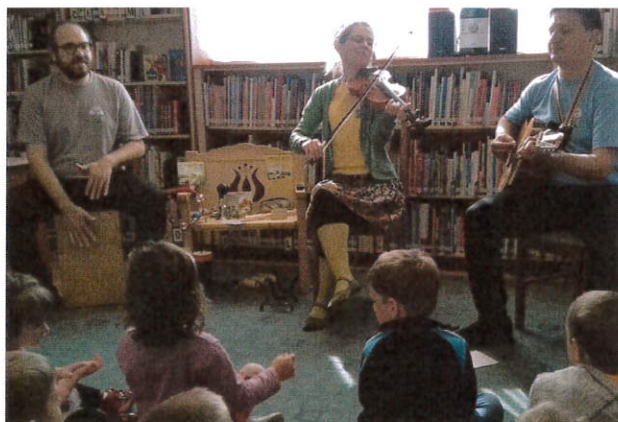
Mesék Diómanóról Vendég: Lóca Együttes