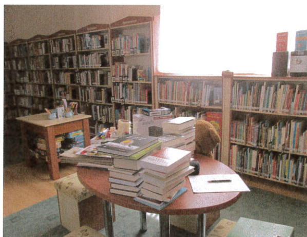
Új könyvek, irodaszerek, egyéb eszközök kiszállítása