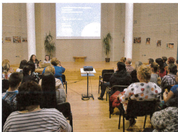
Szakmai nap, 2019. június 5. Bács-Kiskun Megyei Katona József Könyvtár Kecskemét