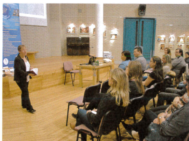
Szakmai nap, 2019. november 4. Bács-Kiskun Megyei Katona József Könyvtár Kecskemét